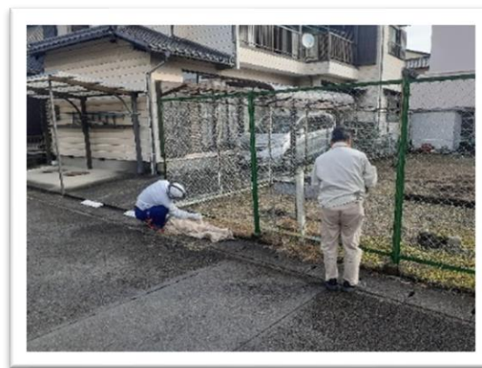
保護者の倉庫や金網フェンスの支柱が大変きれいになりました。ありがとうございました。