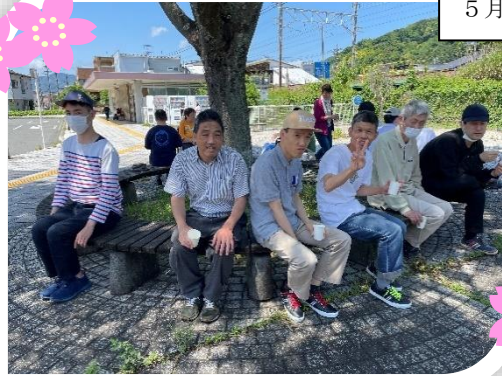
5月土曜開所日、お散歩